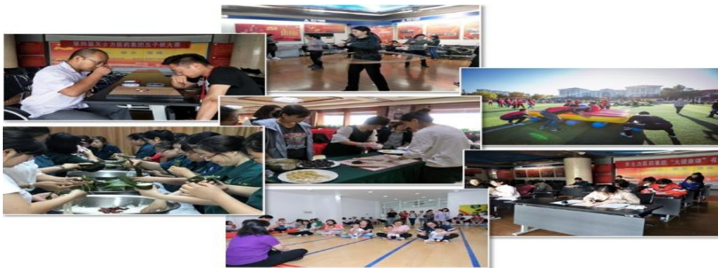
（此图为丰富多彩的员工活动）

2018 年围绕和谐卓越员工文化建设，不断创新活动内容和形式，开展了微信平台价值观有奖竞答、烘焙分享大赛、宝宝大赛、女员工挑战赛、“大健康颂”书法大赛、趣味运动会、大健康知识竞赛等活动，组织员工参加了国防系统女工趣味运动会、国防系统职工运动会等，得到了员工的积极响应和热情参与，超过 2800 人次参与，员工身心都得到放松的同时，弘扬了大健康理念。设立员工健康档案，建立妈咪小屋和职工之家，使员工体会到公司的关爱和家一般的温暖。