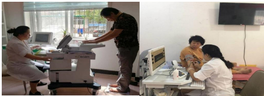
（此图为糖尿病周围神经病变和糖尿病下肢血管检测）