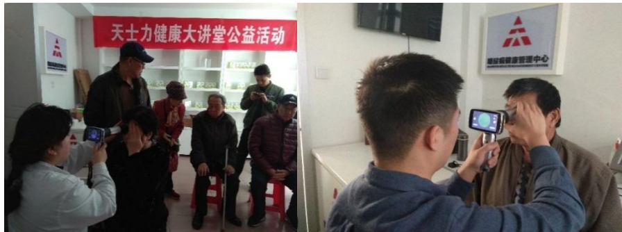
（此图为手持免散瞳眼底相机进行糖尿病视网膜病变的筛查）

病患者，患者在平台上持续接受系统的糖尿病远程教育，加强患者自我管理能力和改善医患关系、提高糖尿病管理质量，规范患者遵医行为，增加患者对医生的依从性，减少了患者入院就医次数，减少了并发症发生，从而使糖尿病患者生活质量提高，同时满足新医改形式的医疗需求。