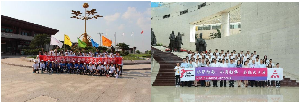
（此图为大学生入司培训图片）

在专业人才培养方面，持续推动班组长体系建设，更新完善班组长学习地图，并以班组长需求调研为基础，定期开展班组长系列培训，2018 年完成班组长培训 6 期，人均培训 8 学时，培训覆盖 92 人次；升级 S-OJT 项目方案，强化组织萃取技能，启动医药集团第二期 S-OJT 项目，实现蓝领技术人才的多元化发展。