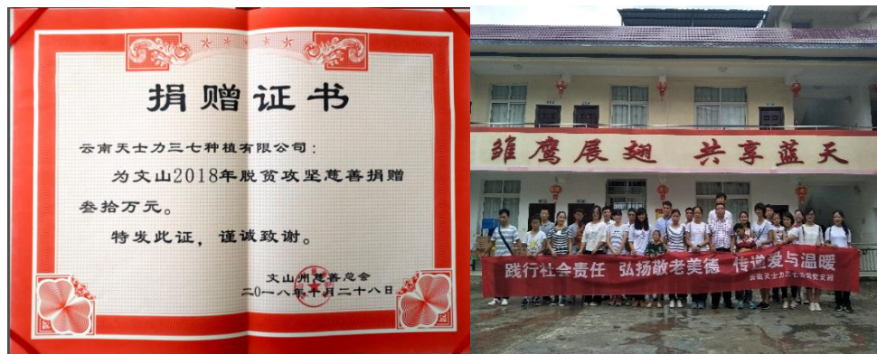
（此图为公益捐赠和福利院活动）

困的精神，积极履行社会责任、参与脱贫攻坚，云南三七公司捐赠 30 万元帮扶资金帮助文山市脱贫。