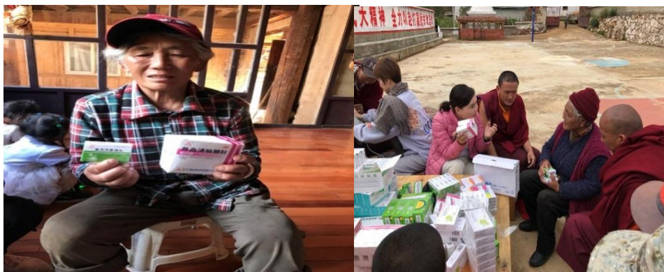
（此图为光彩送药活动）

2018 年，天士力医药集团股份有限公司参与天津市工商联光彩办志愿者西藏义诊送药活动，捐赠复方丹参滴丸 200 盒、养血清脑丸 200 盒，捐赠药品折合 1.46 万元。