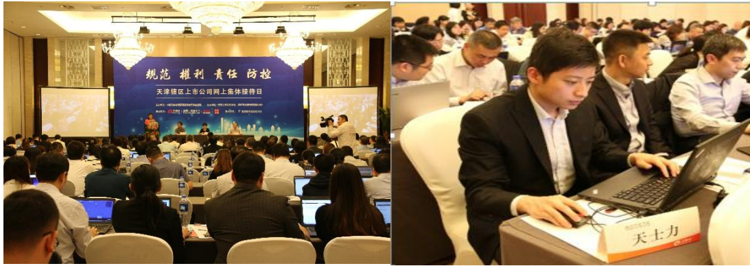
（此图为业绩说明会现场照片）