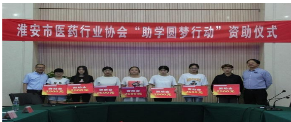
（此图为助学圆梦活动）

报告期内，子公司江苏帝益公司秉承天士力“追求天人合一，提高生命质量”的企业理念及“以人为本，诚信通达”的共同价值观，公司继续帮扶淮安市经济薄弱村盐河镇姚湾村，帮扶该村文化广场建设；作为淮安市医药行业协会会长单位，继续开展“圆梦助学资金”社会公益活动，向江苏食品药品职业技术学院困难学生捐赠 0.5 万元。