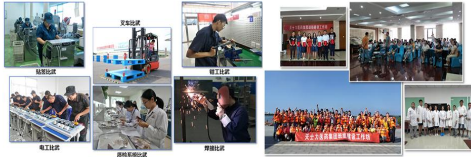
（此图为和谐高效的班组建设及沟通渠道建设）

管理技能，同时做好一线管理者后备人才的储备，提升了班组凝聚力。通过在一一线部门开展多形式、多维度的技能比武，总结推广优秀经验，发掘培养蓝领人才，弘扬工匠精神，显著提升一线员工操作技能。