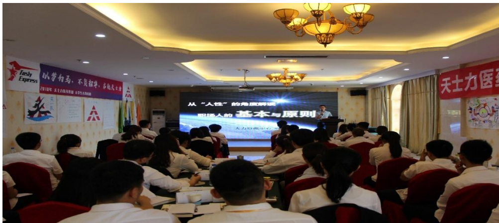
（此图为人才发展项目系列活动）

同时，为提升常规培训对人才培养及公司业务发展的支持力度，一方面促进培训机制的补充与完善，另一方面加强培训资源与运营的优化与创新，同时积极利用政府人才激励政策获取资源支持。截至 10 月底，共计完成人均培训时长 46.4 小时，同比增加 11%；培养内训师 23 人，确保内训师 1:10 的合理配置比例。